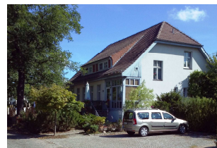
Missionshaus in Falkensee

Auch hier werden wir alle sicherlich gefordert sein. Um-